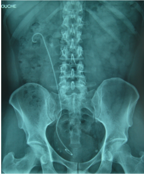
Fig 2: radiografia dell'addome con sonda double JJ posizionata nell'uretere tra rene e vescica